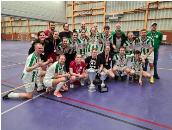
GDVV Martinistad teams pakt PS Cups

D-Zaalvoetbal valt onder auspiciën van Voetbalbond (KNVB). Vanuit KNDSB blijft het goed om te informeren over de nationale dovensportcompetitie. 10 mannenteams verdeeld over 2 klassen en 3 vrouwenteams. In de 1 e klasse werd Fc Zaanstad 1 kampioen en mag naar Deaf Champions League toe. OLDI/Ommoord 1 werd kampioen in de 2 e klasse en gepromoveerd naar de 1 e klasse. DSV Catharijne '83/ Zwaluwen Utrecht '11 vrouwenteam werd kampioen. Zowel vrouwenteam als mannenteam van GDVV Martinistad pakte een Pieter Schiltmans Cup