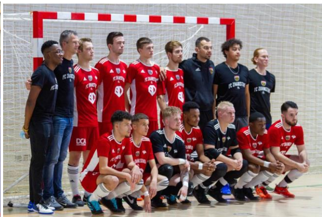
Fc Zaanstad naar Deaf Champions League

Fc Zaanstad mocht als kampioen van 2021-2022 deelnemen aan Deaf Champions League Futsal welke in Zweedse stad Gothenborg werd gehouden. Er werd in poulewedstrijd 1 keer gewonnen, tegen Wolves Y.M., 1 keer gelijk tegen Zebre Charleroi en 1 keer verloren van een sterke Spaanse team C.D.S. Huelva. In kwartfinale moest Fc Zaanstad tegen gastheer I.K. Surd Gothenburg spelen, welke helaas verloren werd met 6-3. Strijd om 5 e plaats werd er kranig gespeeld tegen Real E Non Solo uit Spanje en verrassend won Fc Zaanstad met 3-2. Tegen C.S.S.M. Paris bleef tot het eindsignaal 4-4. Uiteindelijk namen Parijzenaren penalty's beter. Fc Zaanstad werd verdienstelijk 6e.